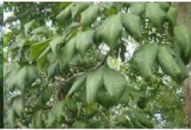
อาการใบเหลืองและขอบใบห่อลง