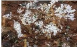
เส้นใยสีขาวของเชื้อรา