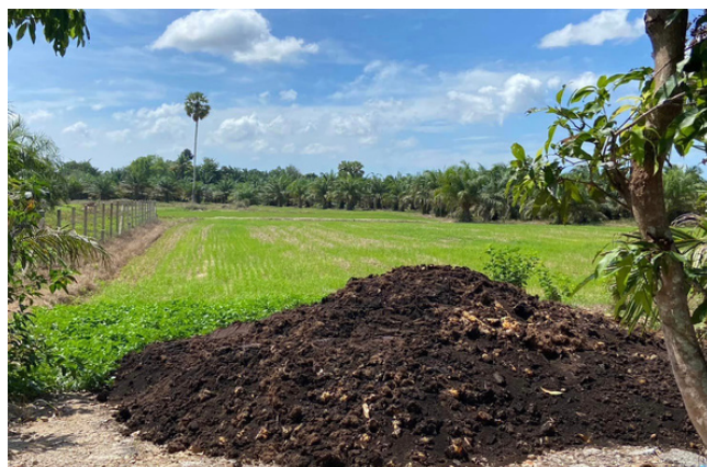
เกษตรกรท่าฉางลงพื้นที่เยี่ยมเยียนและติดตามการดำเนินงานของ Smart Farmer ต้นแบบ พร้อมทั้งตรวจพื้นที่ปลูกข้าวของเกษตรกร