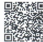
มาตรการเร่งรัดการใช้จ่ายฯ

Handwritten signature and date: ๒๓ พ.ย. ๒๕๖๖