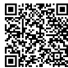
รายงานการประชุมเกษตรอำเภอ ครั้งที่ ๓/๒๕๖๙

รับรองรายงานการประชุมครั้งที่ ๓/๒๕๖๙ เมื่อวันที่ ๒๙ ธันวาคม ๒๕๖๘ ฝ่ายเลขานุการ ได้จัดทำรายงานการประชุมเกษตรอำเภอ และแจ้งให้ตรวจสอบความถูกต้อง โดยได้ส่งทาง Line ผู้บริหารเรียบร้อยแล้ว